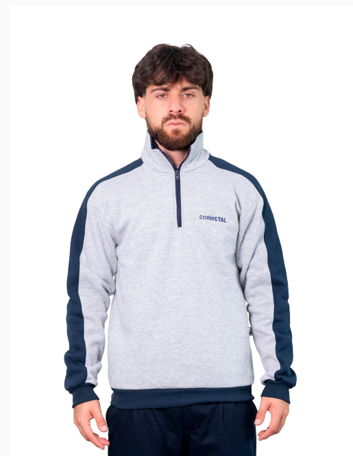
■ BUZO DE FRIZZA ALGODÓN Con cuello y cierre - recorte en mangas. (Cód. B9)