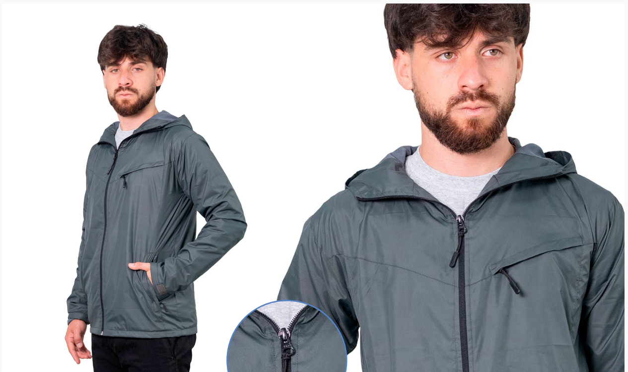
■ CAMPERA DE NEW APTO Línea Evolution (Cód. K14)