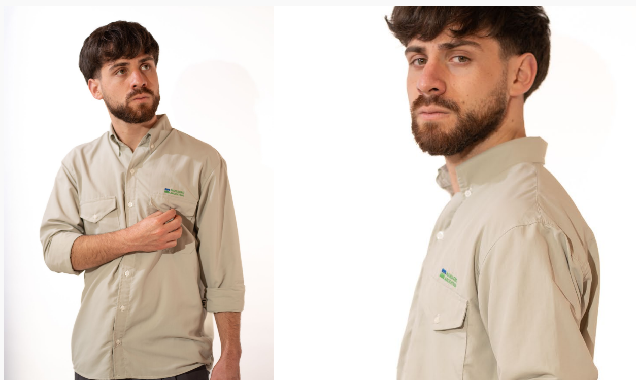
■ CAMISA HOMBRE PROTECCION UV50 Mangas largas. (Cód. C8)