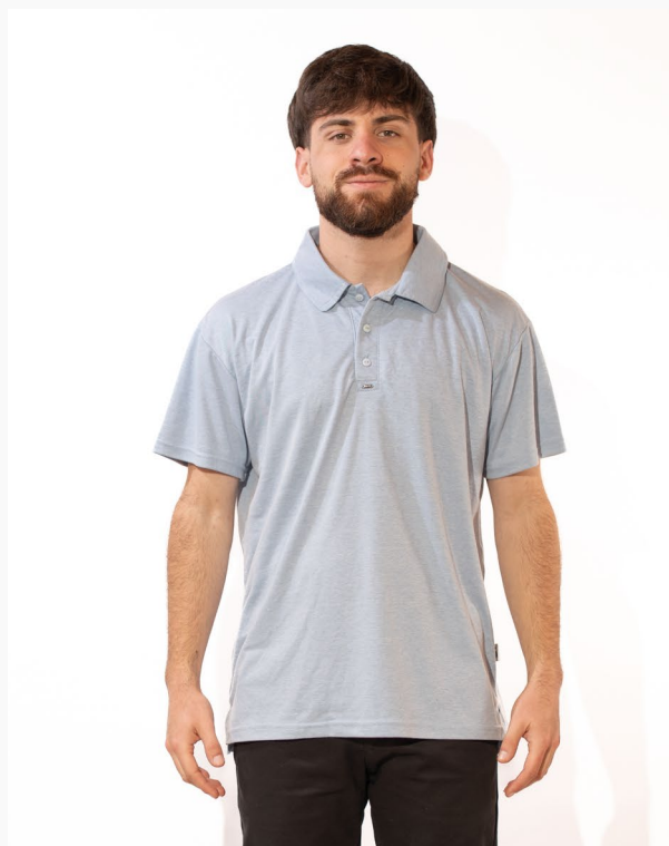
■ CHOMBA DE OXFORD Con cuello tipo camisa titanium. (Cód. M0)