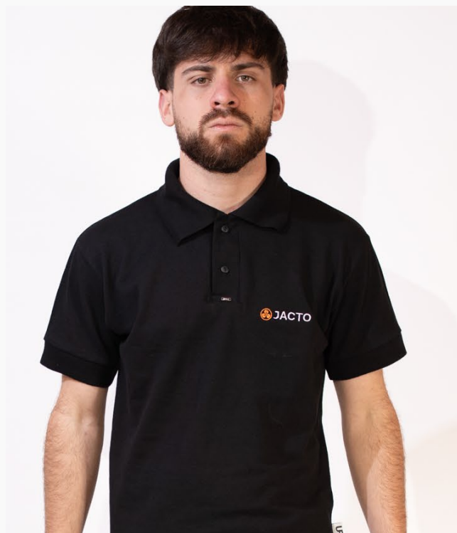
■ CHOMBA DE PIQUET MANGAS CORTAS - LISA (Cód. M2)