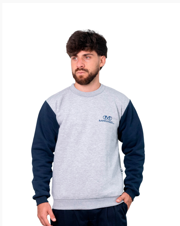
■ BUZO DE FRIZZA ALGODÓN Cuello a la base - mangas combinadas. (Cód. B4)