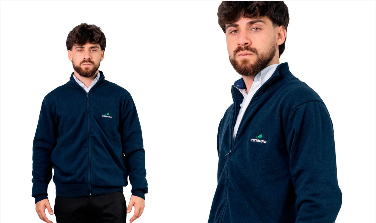
■ CAMPERA DE HILO TEJIDA (Cód. T3)