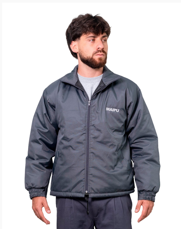
■ CAMPERA ABRIGO DE TRACKER Forrada con matelasse - lisa. (Cód. K3)