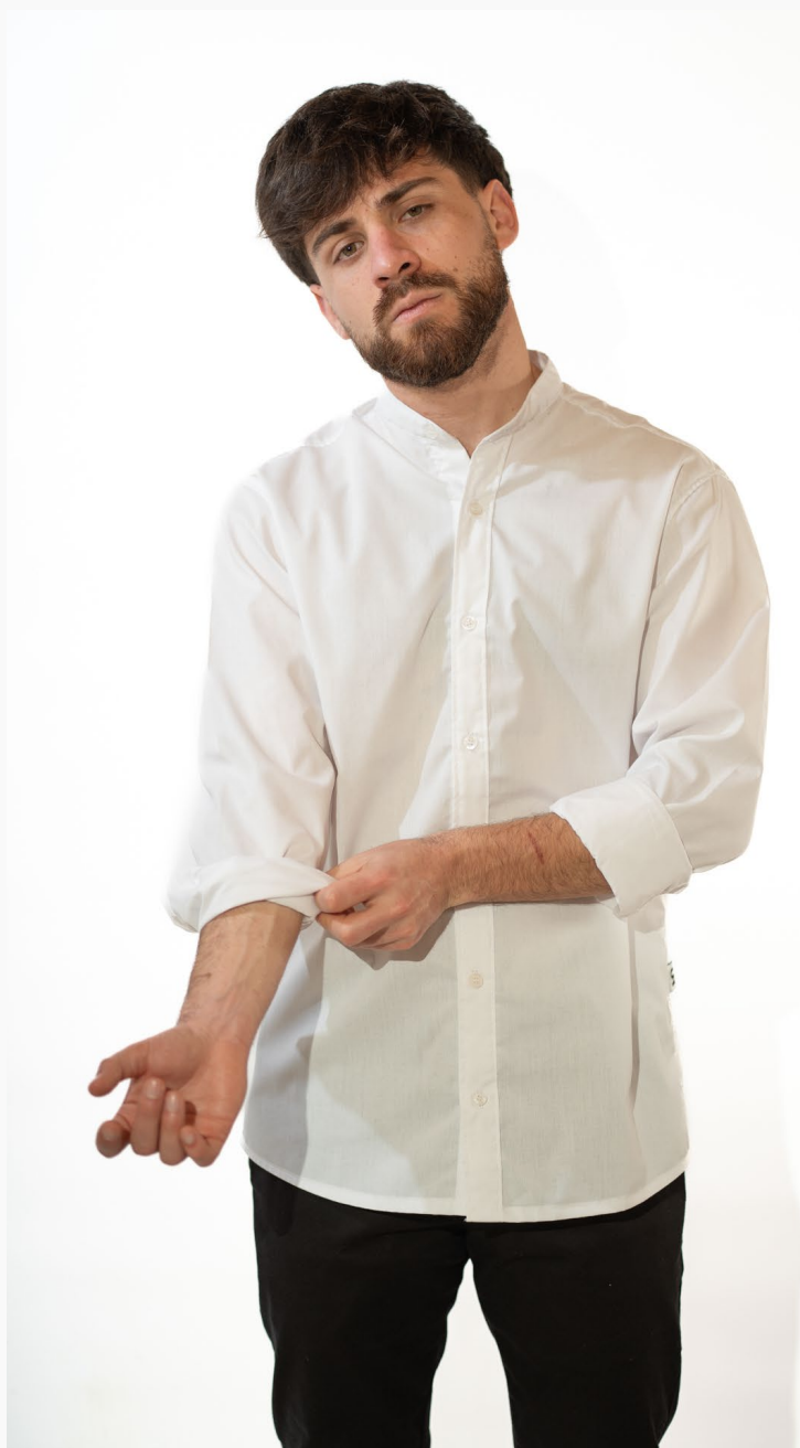
■ CAMISA HOMBRE CUELLO MAO OXFORD Mangas largas. Línea Evolution. (Cód. C0)