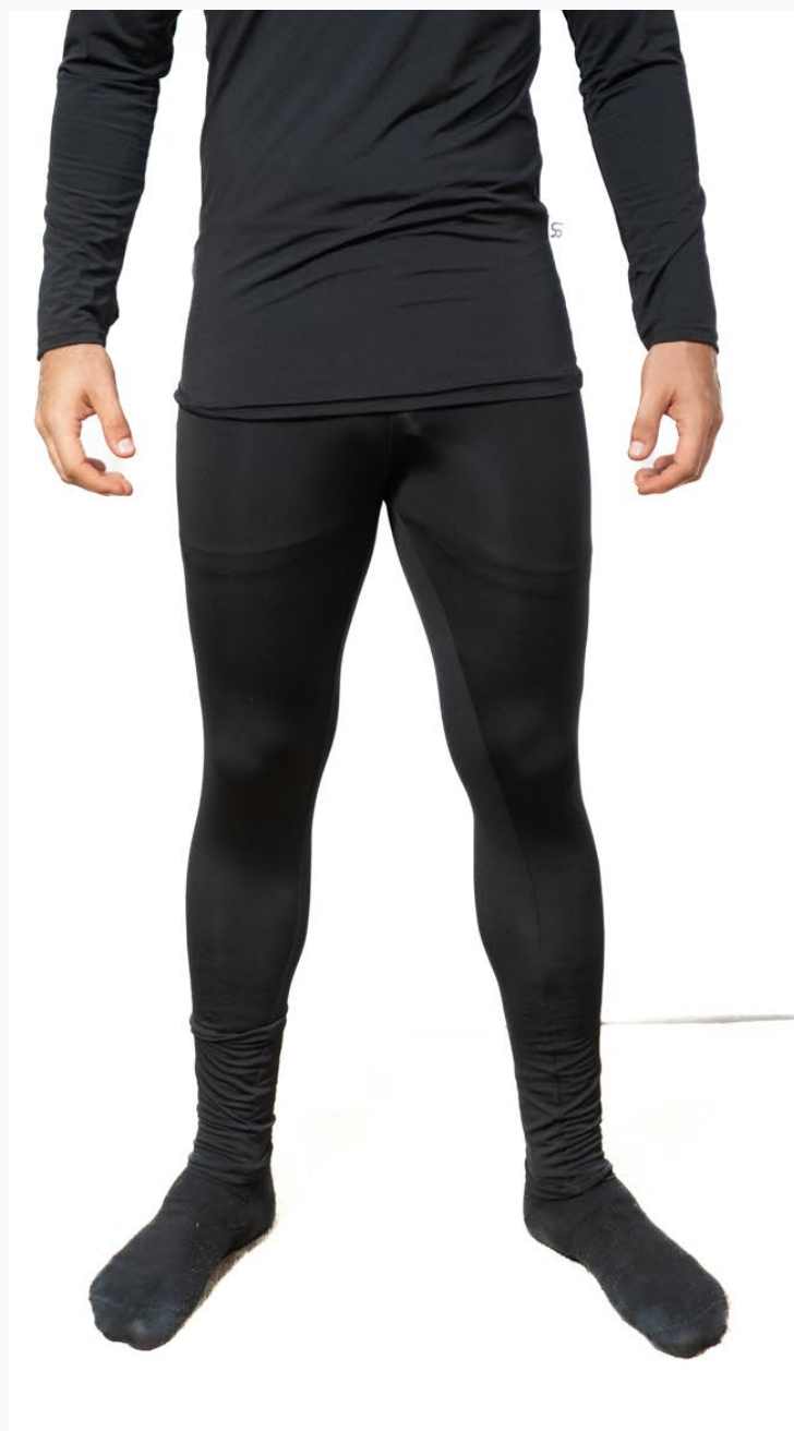
■ REMERA TERMICA De polisoft sensiado.