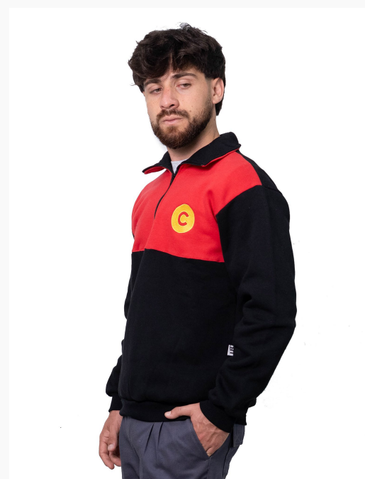
■ BUZO DE FRIZZA ALGODÓN Con cuello y cierre con recorte frontal. (Cód. B10)