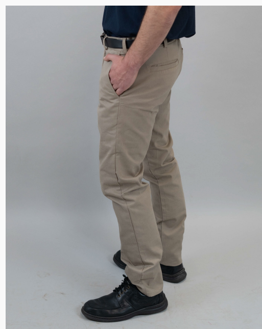
■ PANTALON CORTE CHINO De gabardina microesmerilada. (Cód. P1)