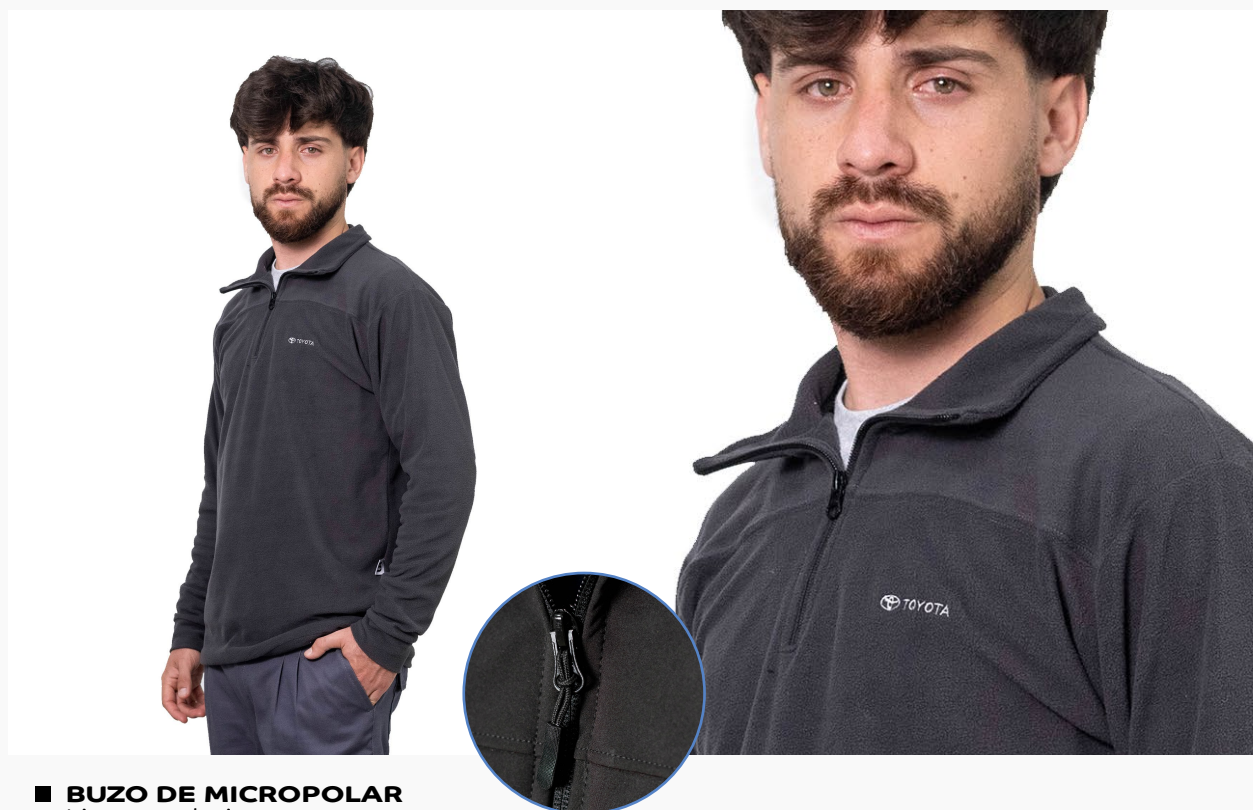
■ BUZO DE MICROPOLAR Linea evolution. (Cód. B1)