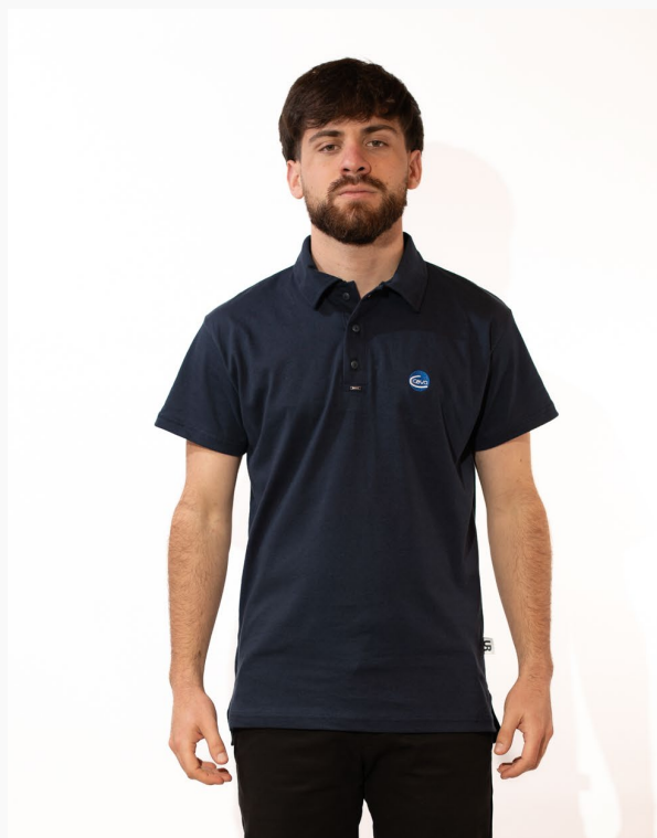
■ CHOMBA DE ALGODÓN PEINADO Con cuello tipo camisa titanium. (Cód. M1)