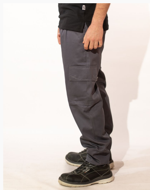
■ PANTALON HOMBRE CARGO De gabardina 6 bolsillos. (Cód. P2)