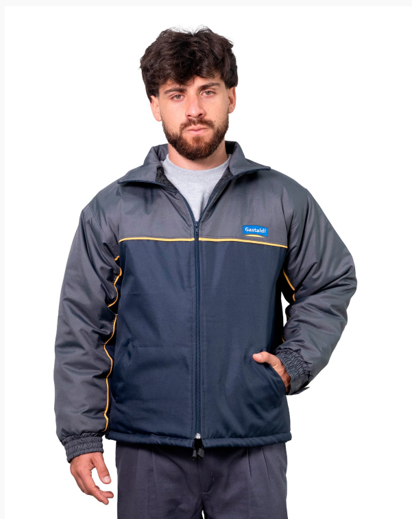
■ CAMPERA ABRIGO DE TRACKER Forrada con matelasse combinada. (Cód. K5)