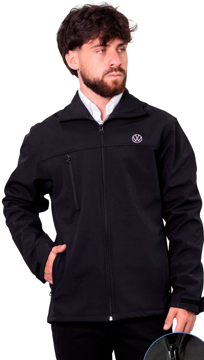
■ CAMPERA SOFTSHELL Línea Evolution. (Cód. K1)