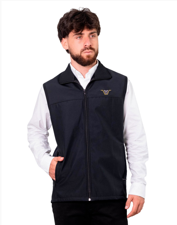
■ CHALECO DE SOFTSHELL (Cód. H2)