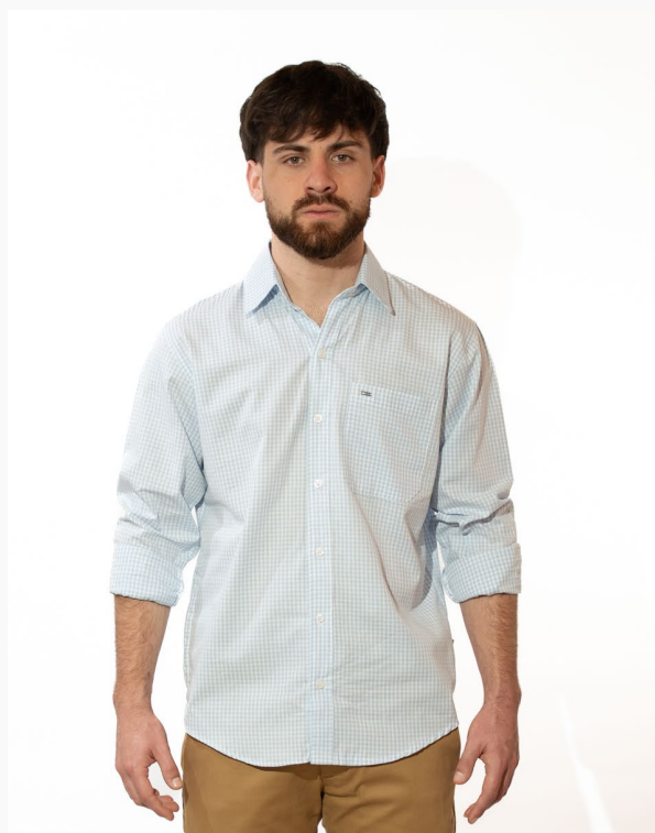
■ CAMISA HOMBRE SLIM POPLIN A cuadros alg/pol mangas largas. (Cód. C3)