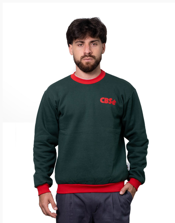
■ BUZO DE FRIZZA ALGODÓN Cuello a la base - cuello, puños y pretinas combinados. (Cód. B3)