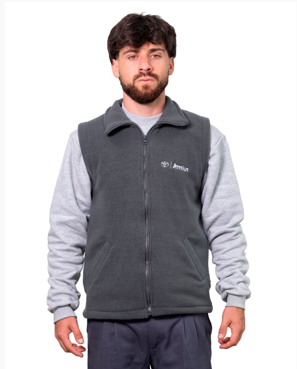
■ CHALECO DE PAÑO POLAR LISO (Cód. H3)