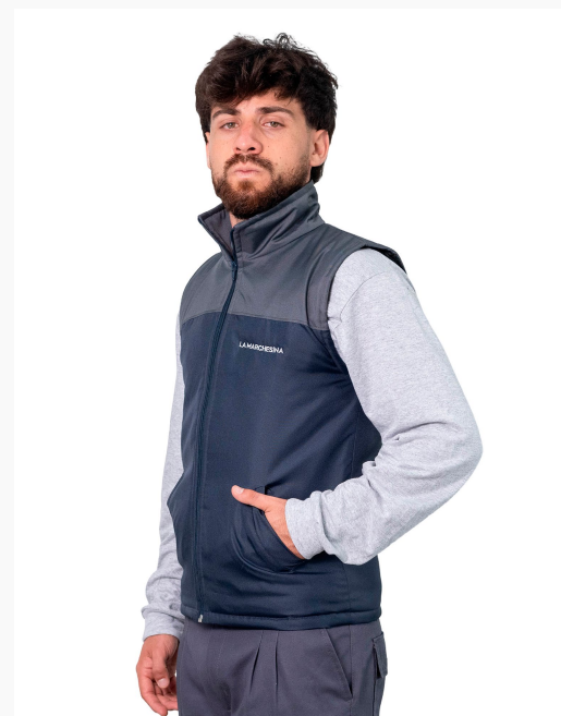
■ CHALECO DE TRACKER Forrado con matelasse combinado. (Cód. H6)