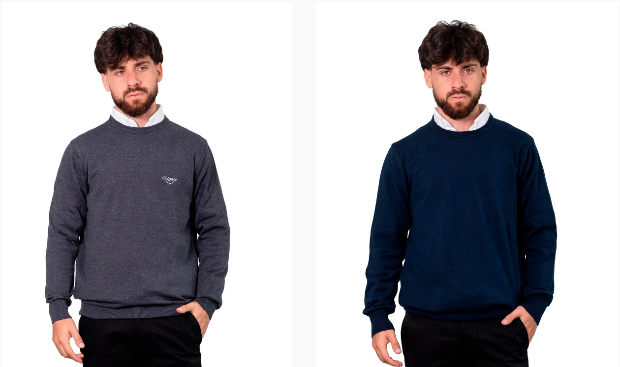
■ SWEATER DE HILO CUELLO REDONDO (Cód. T4)