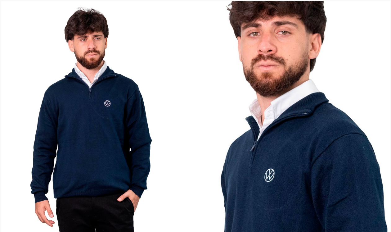
■ BUZO CON CUELLO Y CIERRE DE HILO TEJIDO (Cód. T1)