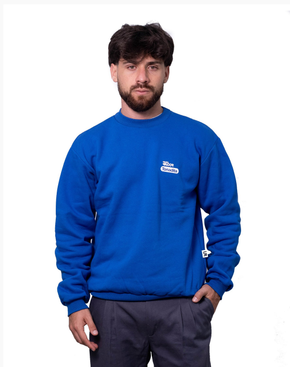
■ BUZO DE FRIZZA ALGODÓN Cuello a la base - liso. (Cód. B2)