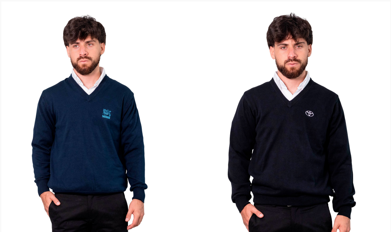
■ SWEATER DE HILO TEJIDO ESCOTE V (Cód. T2)