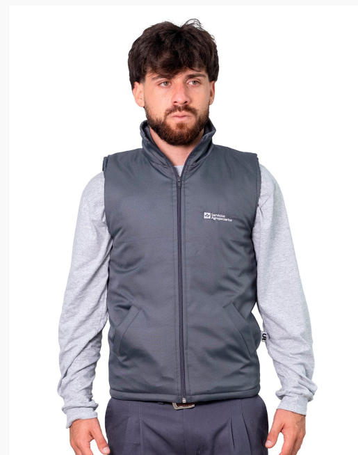
■ CHALECO DE TRACKER Forrado con matelasse liso. (Cód. H5)