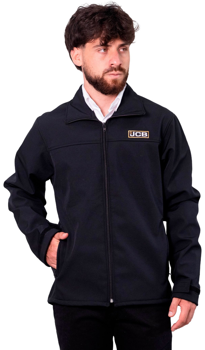
■ CAMPERA SOFTSHELL (Cód. K2)