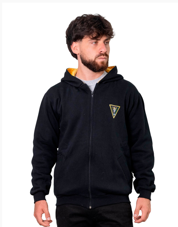
■ CAMPERA DE FRIZZA ALGODÓN Lisa con capucha. (Cód. K10)