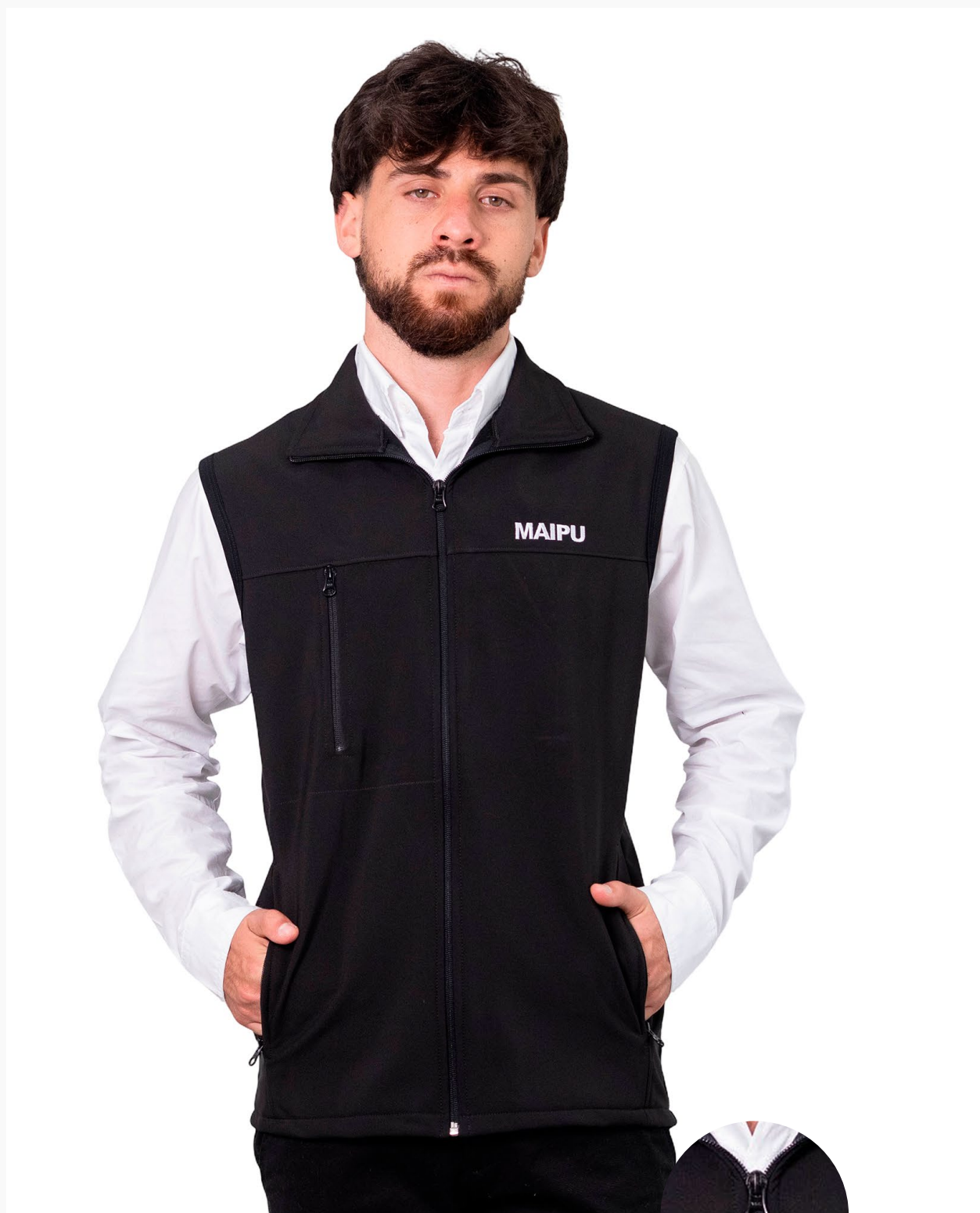
■ CHALECO DE SOFTSHELL Línea Evolution. (Cód. H1)