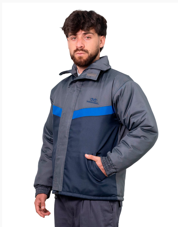
■ CAMPERA ABRIGO DE TRACKER Forrada con matelasse combinada con tapa de cierre. (Cód. K6)