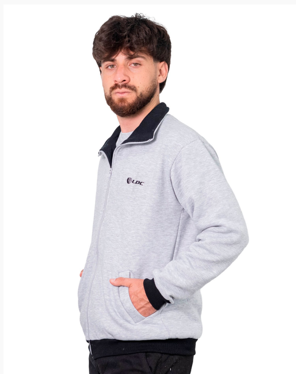
■ CAMPERA DE FRIZZA ALGODÓN Lisa con vistas y pretinas combinadas. (Cód. K9)