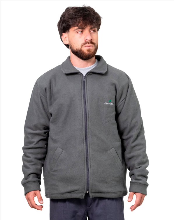
■ CAMPERA PAÑO POLAR (Cód. K12)