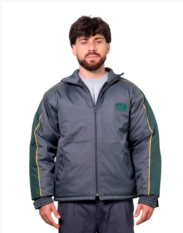
■ CAMPERA ABRIGO DE TRACKER Forrada con matelasse. recorte en mangas. (Cód. K4)