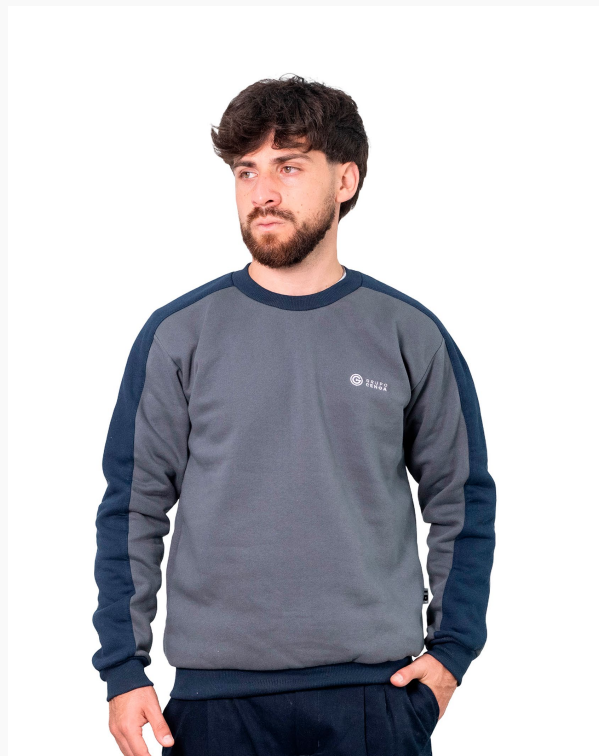
■ BUZO DE FRIZZA ALGODÓN Cuello a la base - recorte en mangas. (Cód. B5)