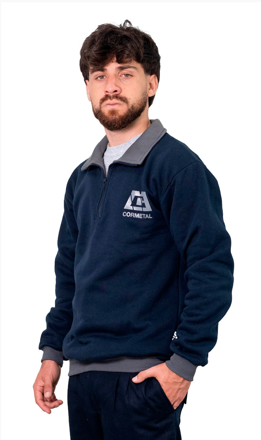
■ BUZO DE FRIZZA ALGODÓN Con cuello y cierre - vistas, puños y pretinas combinadas. (Cód. B8)