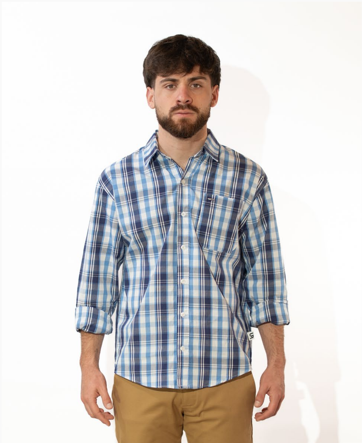
■ CAMISA HOMBRE SLIM POPLIN A cuadros combinados alg/pol mangas largas. (Cód. C6)