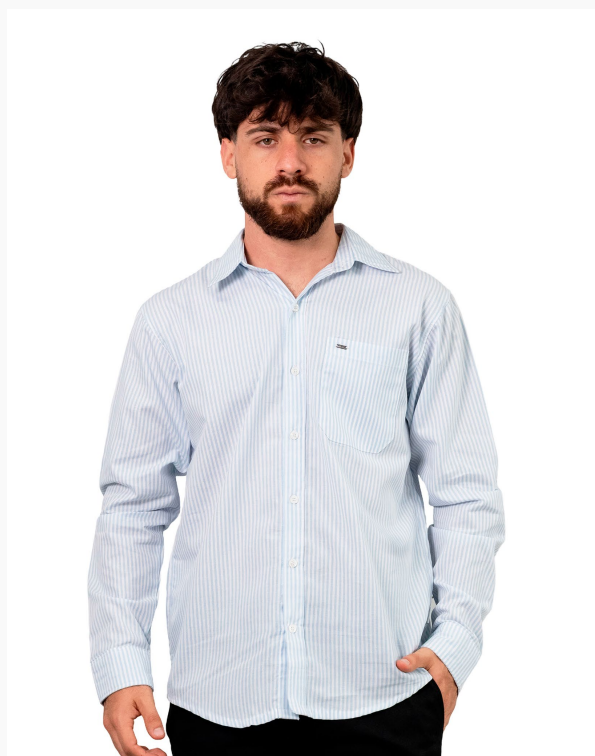
■ CAMISA HOMBRE SLIM POPLIN Rayada alg/pol mangas largas. (Cód. C5)