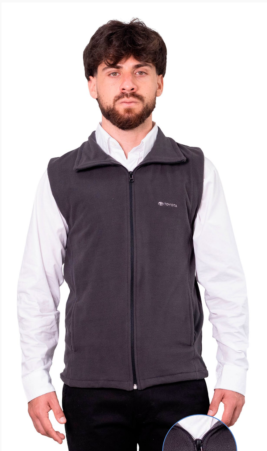
■ CHALECO DE MICROPOLAR Línea Evolution. (Cód. H7)