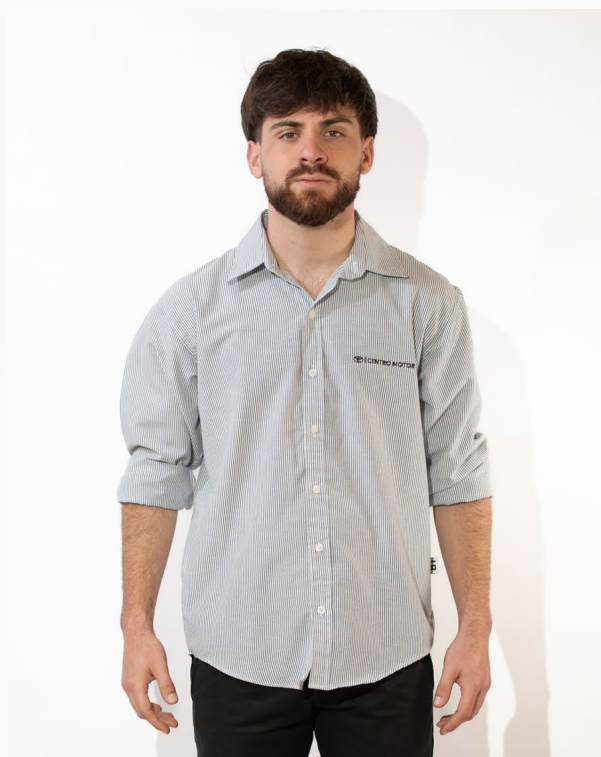
■ CAMISA HOMBRE SLIM BATISTA Rayada alg/pol mangas largas. (Cód. C2)