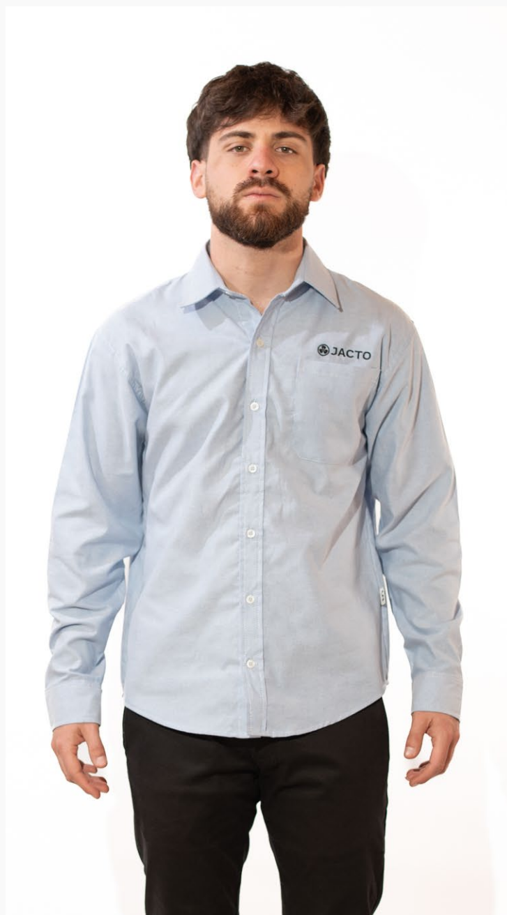
■ CAMISA HOMBRE SLIM OXFORD Mangas largas. (Cód. C1)