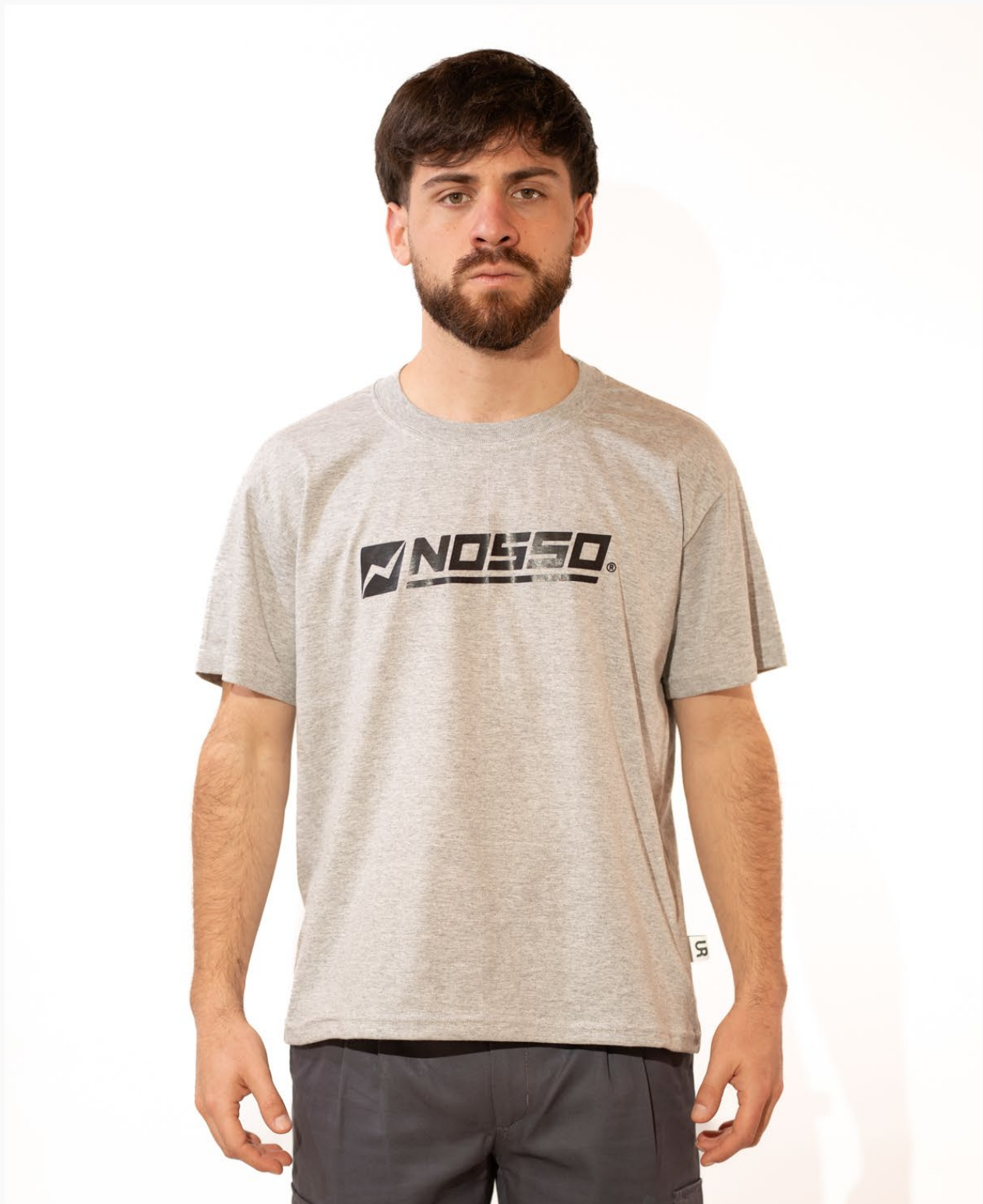
■ REMERA ALGODÓN MANGAS CORTAS COLOR (Cód. R01)