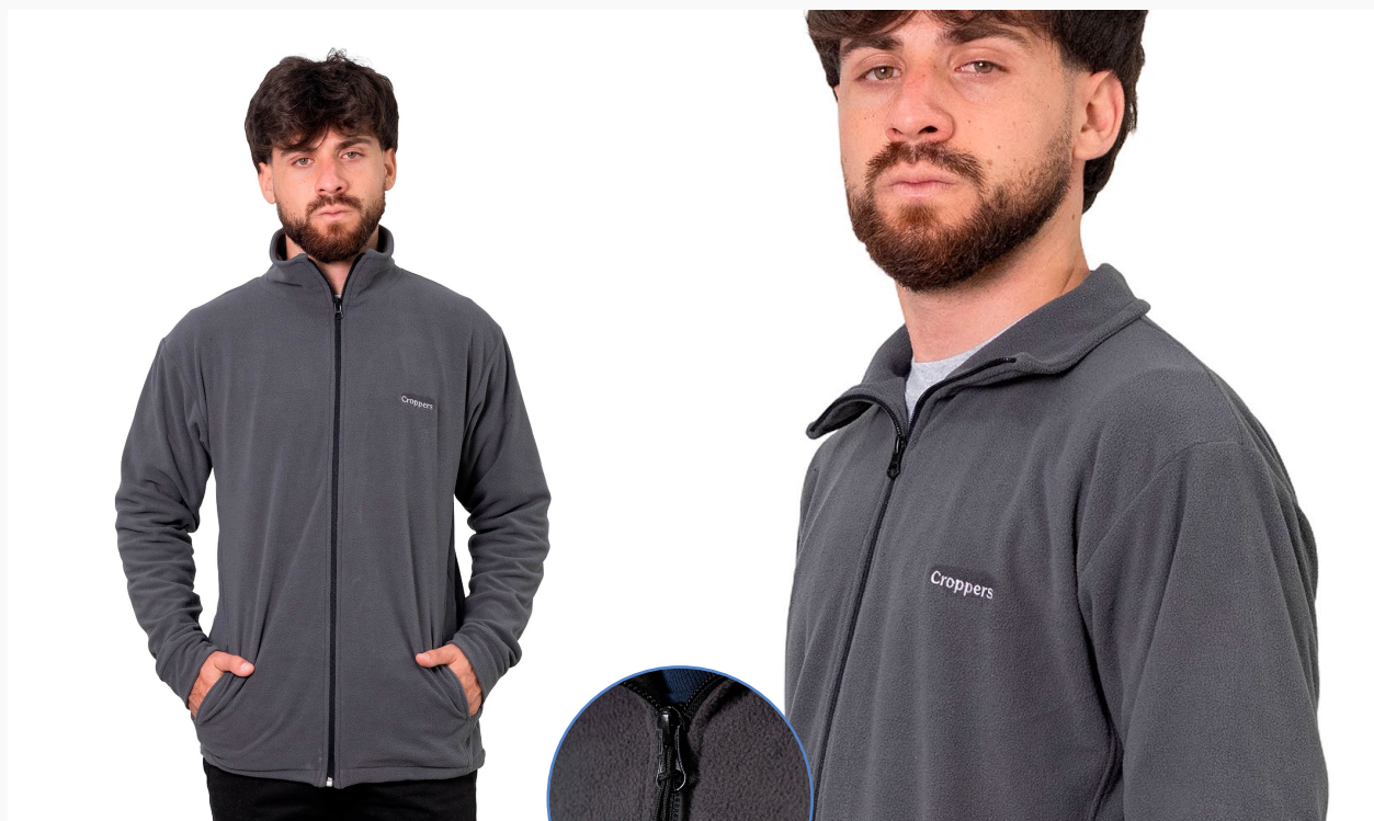
■ CAMPERA MICROPOLAR Línea Evolution. (Cód. K11)