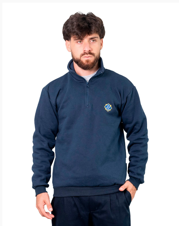
■ BUZO DE FRIZZA ALGODÓN Con cuello y cierre - liso. (Cód. B7)