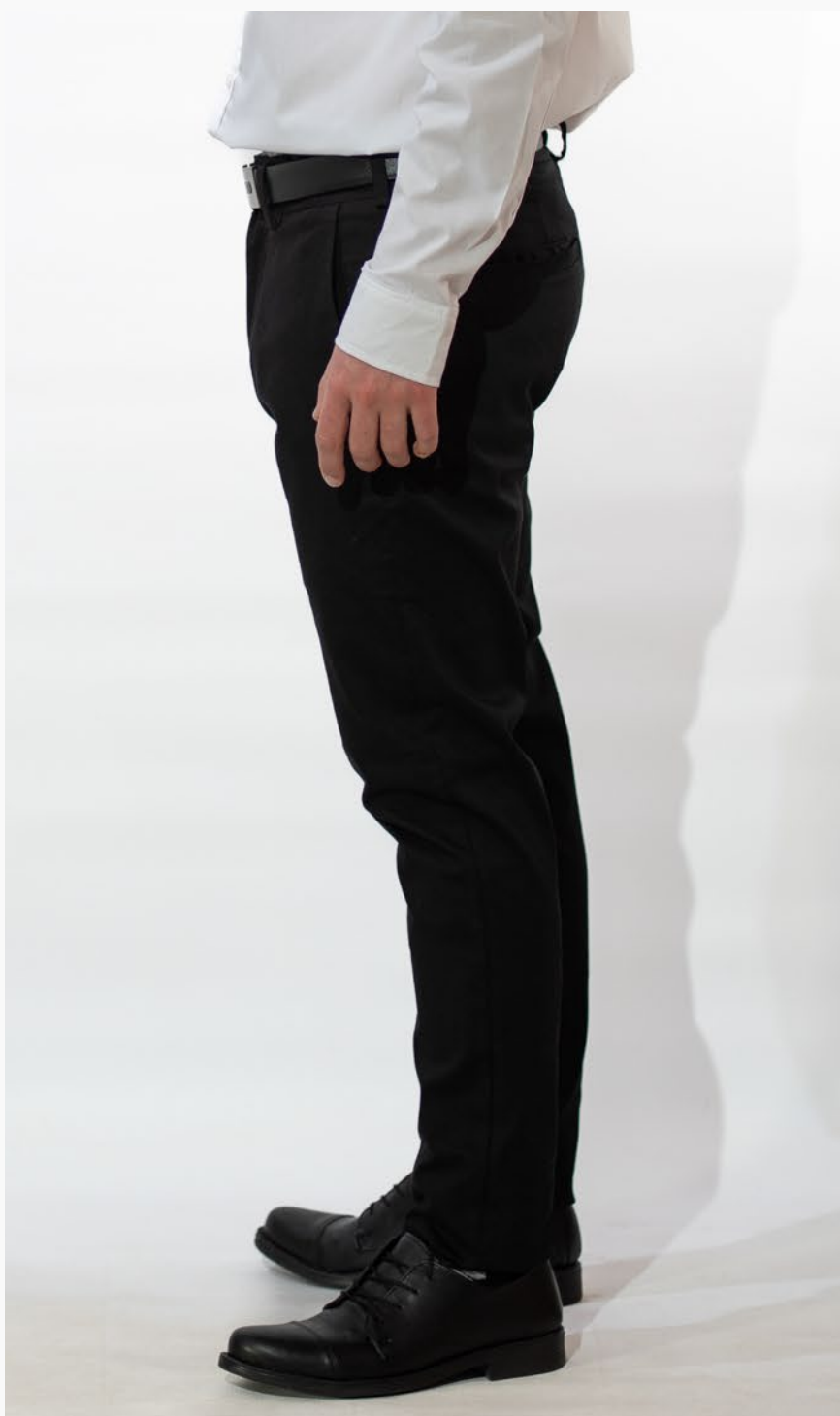
■ PANTALON CORTE CHINO De gabardina elastizada. (Cód. P0)