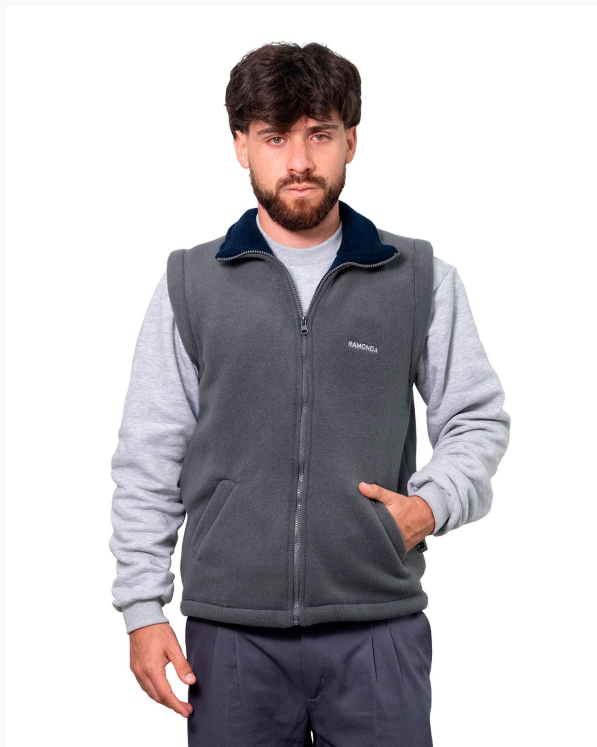
■ CHALECO DE PAÑO POLAR Con vistas combinadas. (Cód. H4)