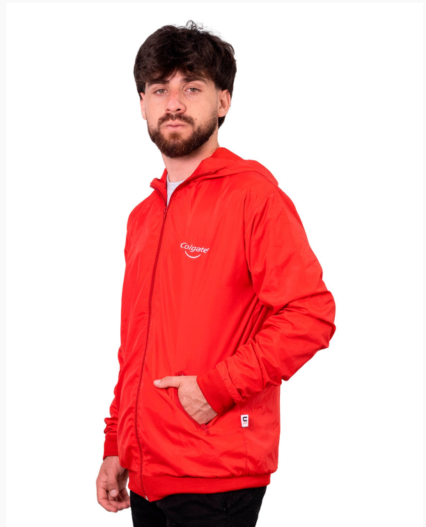
■ CAMPERA DE NEW APTO DUVER Lisa con capucha. (Cód. K13)