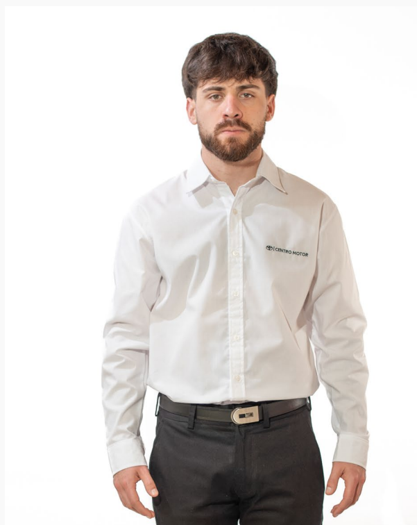
■ CAMISA HOMBRE SLIM BATISTA Lisa mangas largas. (Cód. C4)