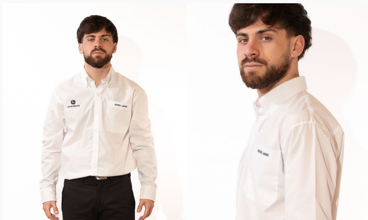
■ CAMISA HOMBRE CORTE CLASICO DE BATISTA Lisa mangas largas. (Cód. C7)