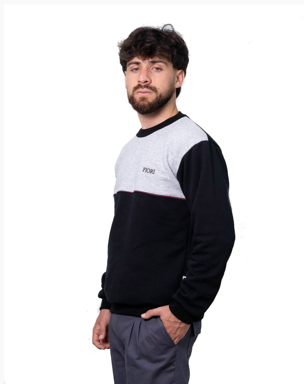
■ BUZO DE FRIZZA ALGODÓN Cuello a la base - recorte frontal. (Cód. B6)